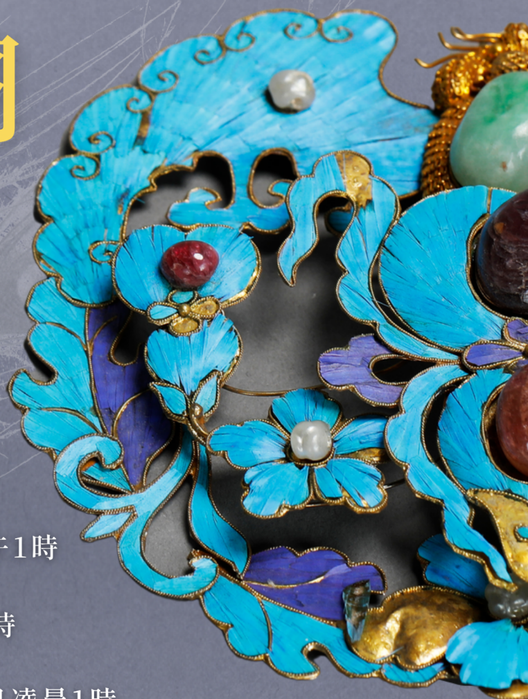
銀鍍金葫蘆紋簪 清代 故宮博物院藏